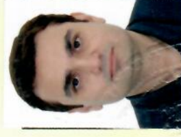
رئیس / اعظم براتی